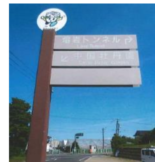
←八束町 案内看板の設置

※請求書は、交付決定後または交付確定後に提出してください。（口座振替依頼書を添付）